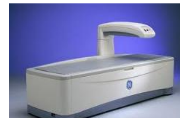
HOLOGIC 社製 Discovery

お問合せ先 河北病院 地域医療支援部 TEL (0237) 71-1505 FAX (0237) 71-1506